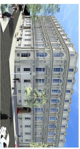
L'ODEON 1 Boulevard de Bruxelles 30000 NIMES