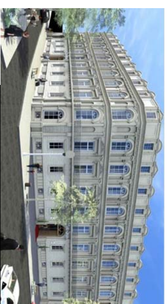
L'ODEON 1 Boulevard de Bruxelles 30000 NIMES