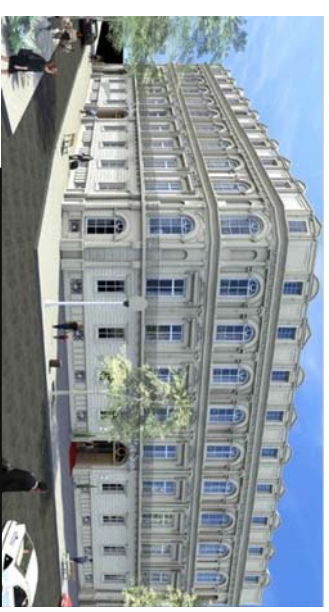
L'ODEON 1 Boulevard de Bruxelles 30000 NIMES